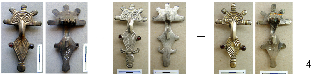
Рис. 117. Ювелирная продукция раннесредневекового Боспора. I. Изделия первого мастера (1 - первая серия пальчатх фибул; 2 - четвертая серия пальчатых фибул); II. Изделия второго мастера (3 - вторая серия пальчатых фибул; 4 - шестая серия пальчатых фибул).